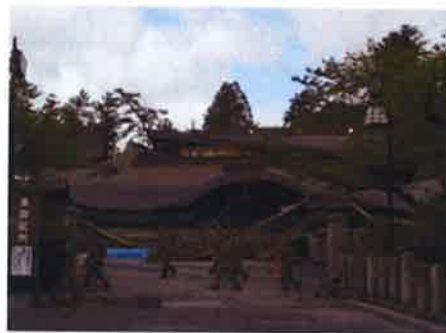
阿蘇神社 楼門(国重要文化財)