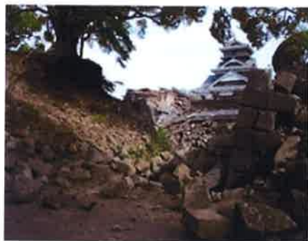
熊本城跡 (特別史跡)

○熊本地震により、熊本城や阿蘇神社をはじめとする国指定文化財から、歴史的価値のある未指定の文化財まで、数多くの文化財が被災。