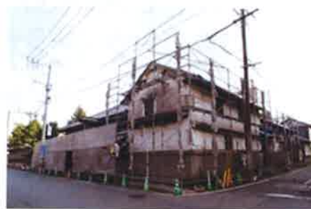
吉田松花堂(未指定)