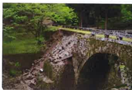
八勢眼鏡橋(県指定)