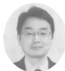
(株)日本政策金融公庫名古屋支店 国民生活事業統轄