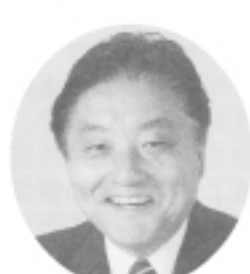
名古屋市長 河村 たかし

今後パブリックサーバントであるという覚悟を忘れることなく、福祉に教育に“あったきゃ”市民をめざして市政を進めてまいりますと考えております。