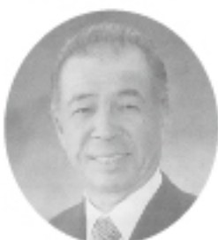
公益社団法人名古屋市食品衛生協会会長 名古屋市食品国民健康保険組合理事長