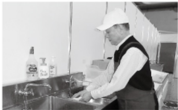
花王様による業務用食器洗剤の提供