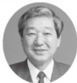
愛知県喫茶飲食生活衛生同業組合 顧問 衆議院副議長 赤松 広隆

新年あけましておめでとうございます。皆様には、ご家族お揃いで輝かしい新年をお迎えになられたこととお慶び申し上げます。昨年は低成長と物価下落の悪循環から復調し株価、生産性とも上方に向っており、経済に明るい兆しが見えてまいりました。一方で、その恩恵を誰もが実感しているとは言い難く、社会全体に行き渡るにはまだ時間が必要だと感じます。その時事の景況に左右されるのが、飲食・外食産業であります。本年は消費税増税もあることから皆様方にとって経営環境の厳しさが増す状況にありますが、私も一刻も早く環境が上向きよう努力を重ねていきたいと思いを強くしております。