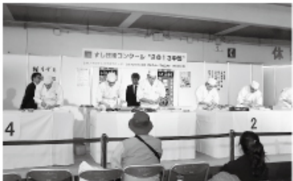
すし技術コンクール