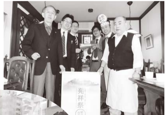
▲東区喫茶スルーにて