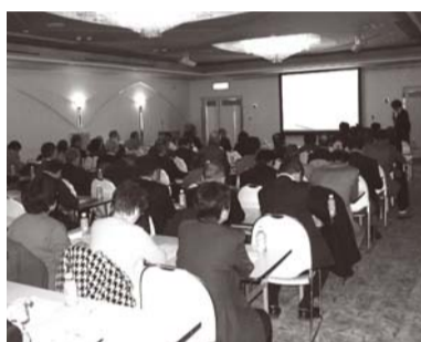
大野講師の話をする参加者

最近起きたアグリフーズ群馬工場で製造された冷凍食品から農薬のマラチオンが検出された事件や敷島パンの和菓子から化学物質が検出され、自主回収となった事例、また浜松市内でのノロウイルスGⅡの大規模食中毒の事例について説明がありました。