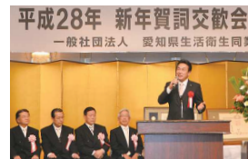
参議院議員 藤川政人様