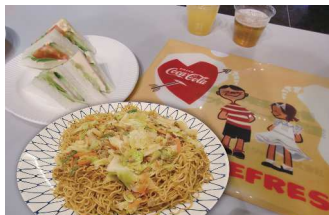
サンドイッチと焼きそば