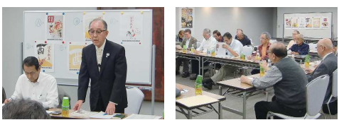
理事長挨拶 理事会の様子

詳細は「ビジエネ」で検索してくだ さい。 https://bizene.chuden.jp/