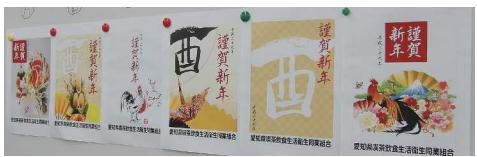
年始ポスター選出