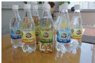
コカ・コーラ(株) ドリンク