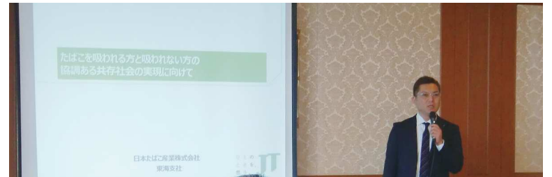
JT様プレゼンテーション