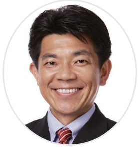
愛知県喫茶飲食生活衛生同業組合 顧問 愛知県議会議員 寺西 むつみ