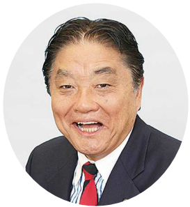
名古屋市長 河村 たかし

あけましておめでとうございます。市民の皆様には、健やかに新しい年をお迎えのこととお慶び申し上げます。