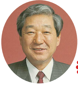
愛知県喫茶飲食生活衛生同業組合 顧問 衆議院副議長 赤松 広隆