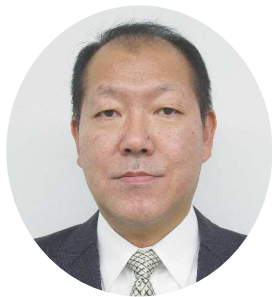
日本政策金融公庫名古屋支店 国民生活事業統轄