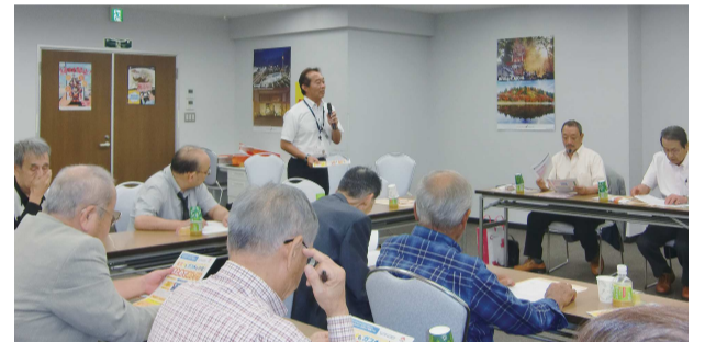
中部電力(株)山田氏によるプレゼン