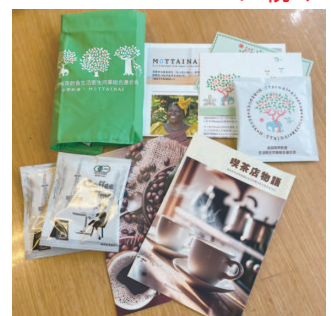
配布したセット一式

私たちUCC コーヒープロフェッショナル株式会社は、UCCグループの業務用サービス事業の中核を担い永年培ってきたコーヒーに関する専門知識や技術、ノウハウなどをDNAとして持つ業務用食品卸企業です。お問い合わせ等、何なりとお気軽にご連絡ください。