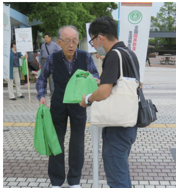
通行人の方へ配布の様子