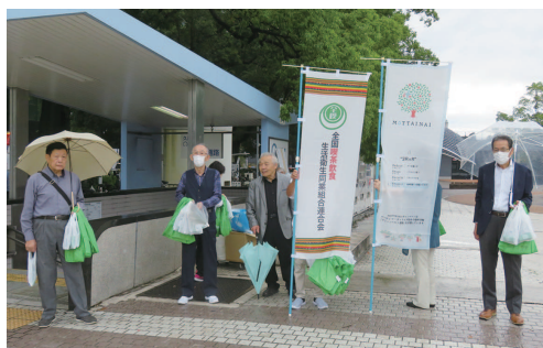
配布のお手伝いをする役員さん