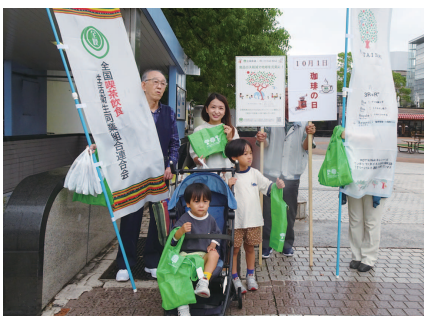
お子様連れのご家族と写真撮影