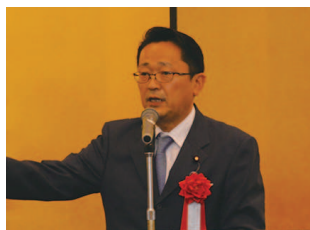
連合会顧問 丹羽衆議院議員